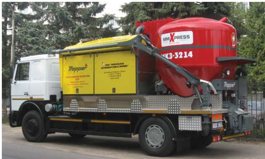
МКЗ в крестьянском хозяйстве «Луч» Свердловской области