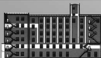
УП «Борисовский КХП» Реконструкция и модернизация производственных мощностей сортовой мельницы (2007 г.)