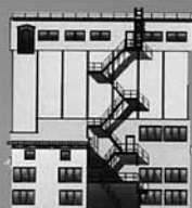
ОАО «Минский КХП» Блок металлических бункеров для бестарного хранения и отпуска отрубей (2007 г.)