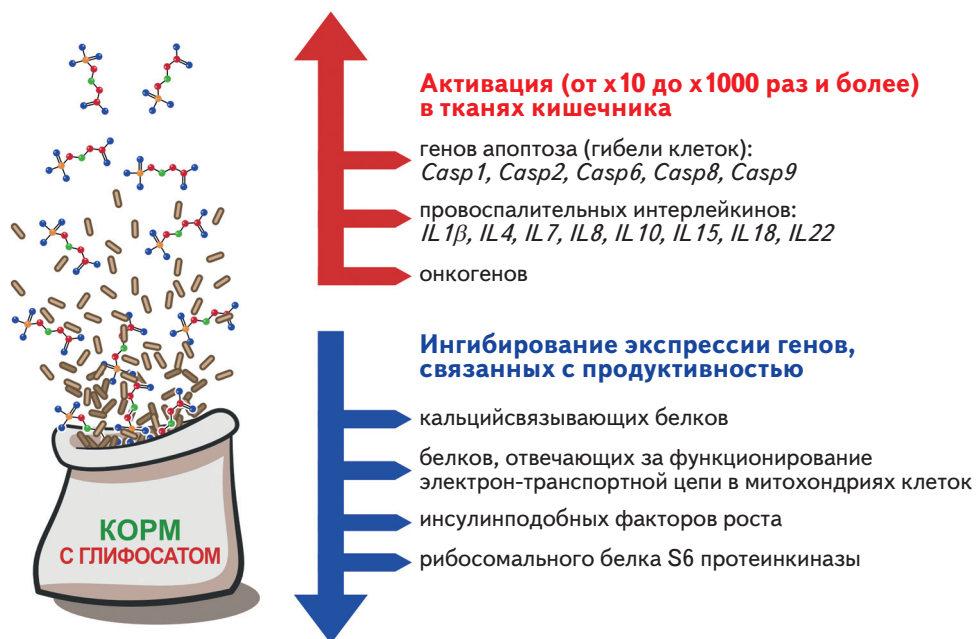
Рис. 1. Влияние кормов, содержащих глифосат, на транскриптом у бройлеров (установлено с помощью метода секвенирования RNA-seq)

Исследования ученых НПК «БИОТРОФ» показали, что вклад токсичных кормов в нарушение экспрессии генов и состава микробиома можно снизить с помощью изменения стратегий кормления. Были разработаны методы противостояния токсическому действию глифосата и других ксенобиотиков на сельскохозяйственных животных и птицу. Так, метапробиотик Пробиоцид-Ультра объединяет комбинацию естественных бактериальных метаболитов (фумаровой и лимонной кислот) и двух штаммов Vacillus sp. , действующих в синергизме. С одной стороны, Пробиоцид-Ультра эффективно стимулирует рост нор-