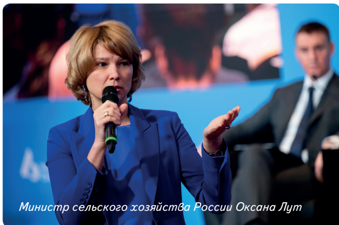
Министр сельского хозяйства России Оксана Лут

Министр сельского хозяйства Оксана Лут в ходе пленарной дискуссии, посвященной реализации национального проекта «Технологическое обеспечение продовольственной безопасности», конкретизировала некоторые из приоритетов развития молочного направления АПК до 2030 г. Так, необходимо увеличить численность молочного стада в сельскохозяйственных организациях с 2,52 млн до 2,89 млн голов, а среднюю продуктивность племенных коров — до 11 т молока в год. К основным задачам она причислила создание 662 тыс. скотомест (в 2024 г. — 57,2 тыс.) и достижение обеспеченности отрасли племенным поголовьем отечественной селекции в количестве 900 тыс. голов (в 2024 г. — 162 тыс.). Глава Минсельхоза рассказала, что для повышения качества молочного поголовья КРС в ведомстве разрабатывают