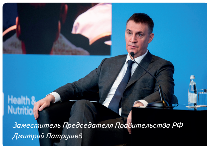
Заместитель Председателя Правительства РФ Дмитрий Патрушев

Вместе с тем он обозначил вызовы, с которыми сталкивается индустрия. Среди главных — высокая ключевая ставка и текущие экономические условия. Отмечая решающую роль, которую играет государственная поддержка как фактор нивелирования данных вызовов, руководитель союза обратил внимание на вопросы, которые беспокоят бизнес-сообщество. Это пересмотр условий по выданным кредитам на 2025 г., а также включение перерабатываю-