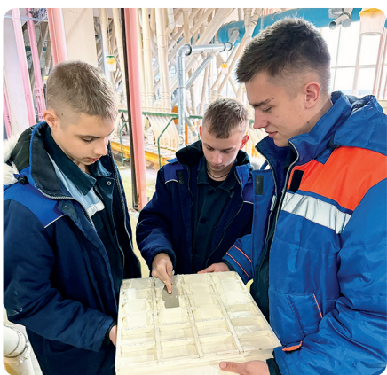
Производственная практика студентов на мукомольном комбинате «Володарский»

также с органами государственной и муниципальной власти, службой занятости, вузами и другими заинтересованными сторонами. Многие студенты после производственной практики остаются работать у социальных партнеров. Надо отметить, что спрос на специалистов колледжа, обслуживающих зерноперерабатывающие предприятия, с каждым годом растет, поэтому трудоустройство выпускников по этим направлениям достигает 100%.