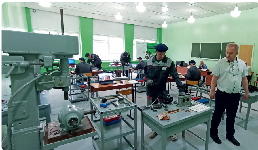
ЦПДЭ по специальности «Монтаж, техническое обслуживание и ремонт промышленного оборудования» во время проведения ГИА

В этом учебном году отмечает 85-летие и система среднего специального образования страны. Колледжи и техникумы сейчас находятся в центре внимания государства — и как кузница специалистов среднего звена и рабочих, необходимых экономике, и как образовательный выбор для российских подростков.