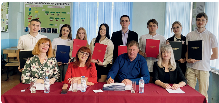
Дипломные работы успешно защищены

Журнал «Комбикорма» играет немаловажную роль в образовательном процессе, обеспечивая студентов и преподавателей актуальной информацией, которая способствует усвоению знаний и развитию профессиональных компетенций, помогает сделать образовательный процесс более насыщенным и актуальным, быть в курсе последних тенденций и разработок в области производства комбикормов. Это позволяет сформировать у студентов практические навыки, необходимые в профессиональной деятельности.