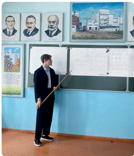
Защита дипломного проекта

Надо отметить, что оформление и содержание журнала находятся всегда на высоком профессиональном уровне. Материалы, представленные в нем, используются при изучении технологического оборудования, процессов производства комбикормовой продукции, методов оценки качества сырья и готовой продукции. В журнале публикуется большое количество иллюстративного материала в виде фотографий, схем, диаграмм, таблиц.