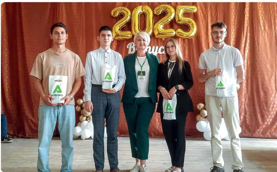
Вручение подарков лучшим студентам от ГК «Агроэко»

Надо сказать, что колледж довольно твердо стоит на ногах в это непростое и довольно переменчивое время. Все семь направлений подготовки профессий и специальностей входят в Топ-50: «Системное администрирование», «Монтаж, техническое обслуживание и ремонт промышленного оборудования», «Хлебопечение», «Кондитерское производство», «Коммерция», «Торговое дело», «Мастер сельскохозяйственного производства». Колледж планирует открыть новые специальности и профессии для подготовки востребованных на рынке труда специалистов.