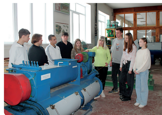
Знакомство с оборудованием машинного зала колледжа