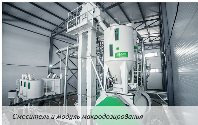
Смеситель и модуль макродозирования

три месяца. За это время специалисты «СП Ашкардарский» собственными силами построили новое здание для размещения комбикормового завода, осуществили подготовку площадки и подвод сетей по проекту «Доза-Агро». Монтаж технологического оборудования проводился силами «СП Ашкардарский»; настройка автоматики, обкатка, пусконаладочные работы — специалистами «Доза-Агро».