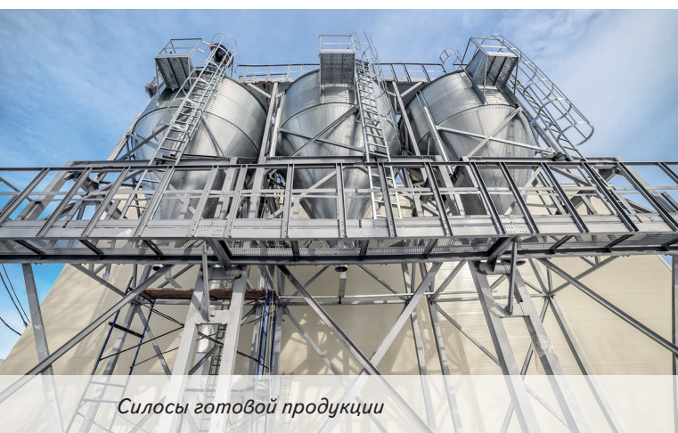
Силосы готовой продукции

В феврале 2020 г. на базе «СП Ашкардарский» состоялся зональный семинар по развитию животноводства в республике. В мероприятии приняли участие представители Министерства сельского хозяйства РБ, глава Мелеузовского района и заместители глав администраций по сельскому хозяйству десяти районов республики, руководители подведомственных организаций, республиканских союзов, СХП и КФХ.