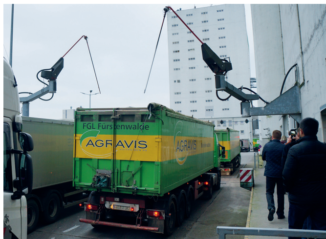
Рис. 2. Отбор проб сырья при входном контроле качества

Таким образом, можно констатировать, что производство комбикормов в Германии, как и качество реализуемой