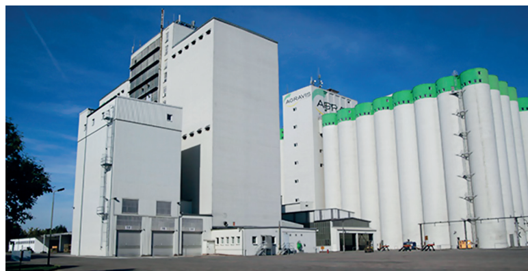
Рис. 1. Завод по производству и хранению комбикормов Agravis (Германия)

Наряду с получением навыков в области торговли, производства кормов и осуществлении контроля качества продукции стажировщики ознакомились с принципами работы сельскохозяйственных торговых центров; с информацией о сельскохозяйственных услугах в сферах: оборота удобрений и посевного зерна, защиты растений, а также о мобильных измельчителях и о мобильных установках для смешивания кормов; с защитой сельскохозяйственных продуктов от ценовых рисков через фьючерсные биржи; с технологиями очистки и сушки зерна, складирования сельскохозяйственных продуктов.