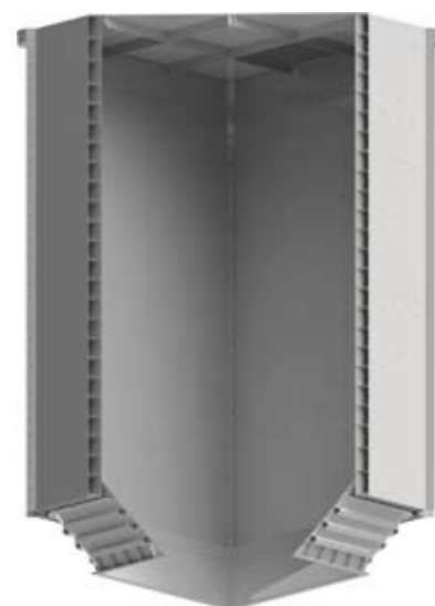
Рис. 2. Бункер в разрезе