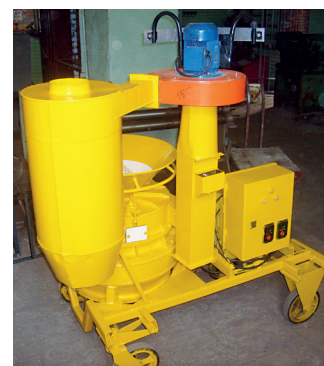
Рис. 2. Шелушитель-сепаратор семян зернобобовых культур

С учетом рекомендаций по выбору рациональных пара-