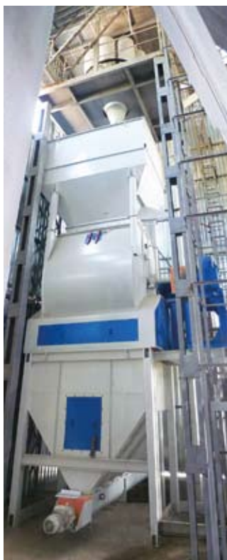
Узел смешивания на базе ЗСЛ-4000 с модулем микродозирования компонентов МДК-50-8 (комбикормовый завод компании «Агропродсервис»)

транспортерах, шнеках, в дробильных отделениях. Их преимущество в компактности и обеспечении несмешивания аспирационных отсосов от разных единиц оборудования.