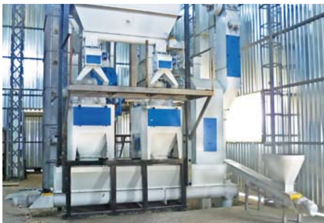
Локальные фильтры в узле измельчения сырья (комбикормовый завод компании «Агропродсервис»)

транспортерах, шнеках, в дробильных отделениях. Их преимущество в компактности и обеспечении несмешивания аспирационных отсосов от разных единиц оборудования.